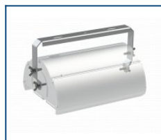
Кронштейн лира Angar 60 (комплект)