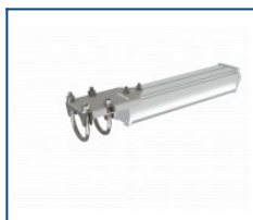
Кронштейн консольный Piton/Angar (комплект)