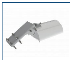
Кронштейн консоль поворотная Piton/Angar (комплект)