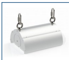
Кронштейн рым-гайки Angar (комплект)